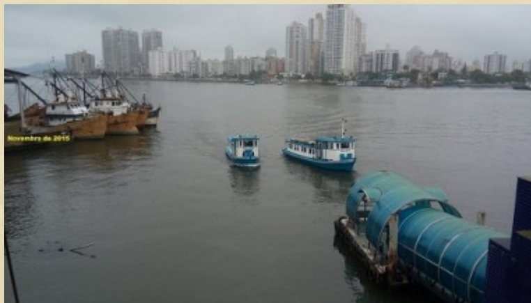
Vendo a Ponta da Praia-Santos/SP do Guarujá

Caio e Isabel, até aquele momento, era uma poesia interminada(*).