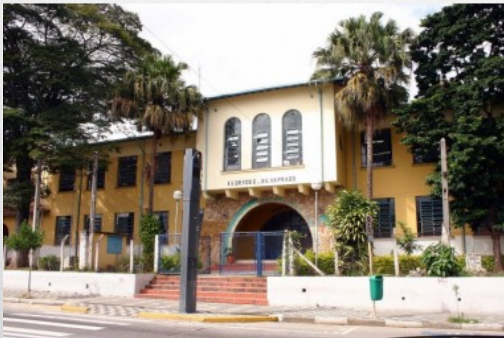
Colégio e Escola Normal Estadual Dr. Francisco Gomes da Silva Prado

Foi professor e Vice-Diretor da Rede Municipal e Estadual de Ensino de Caraguatatuba.