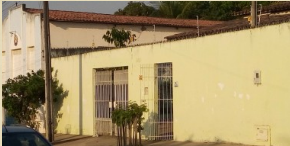
Igreja Católica do Parque Servilha

CRAS do Bairro Pampalona que foi instalado no Loteamento Parque Servilha sendo o responsável por organizar e oferecer serviços da Proteção Social Básica nas áreas de vulnerabilidade e risco social