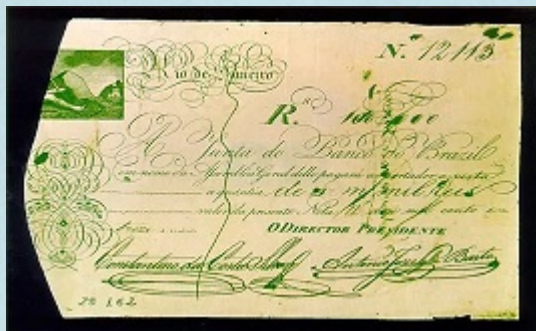
Bilhete do Banco do Brasil