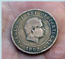
Moedas de Portugal 1802

Assistimos a um power point que contava a historia do dinheiro Aprendemos várias curiosidades.