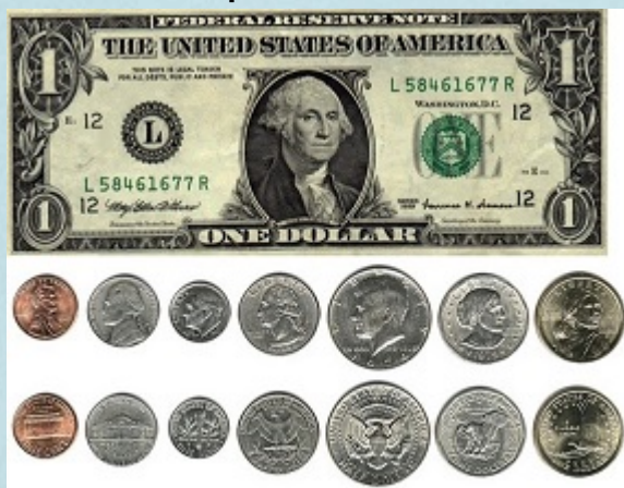
Estados Unidos: dólar e cent