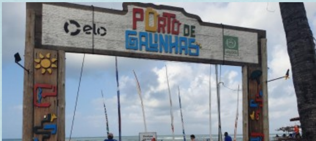
Entrada da praia porto de galinhas.

O passeio no porto de galinhas , foi o passeio que mais me lembro, foi uma praia que fica localizada entre uma ruazinha que tinha lojas, tinha restaurantes e tinha estátuas que representavam o “porto de galinhas” com placas para onde ir. As comidas de lá também eram ótimas, camarões, lulas e polvos foi o que comemos lá. A praia era cristalina e linda, com lojas de artesanatos, que eu e minha mãe amamos, principalmente minha mãe, por conta que ama compras e ama ainda mais enfeites/artesanatos para a casa.