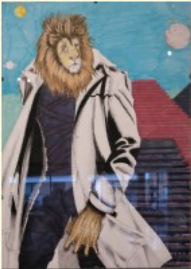
- imagem de inspiração

Gostei bastante de trabalhar neste trabalho, inspirei-- me na obra do André Vila Franca e criei a minha.