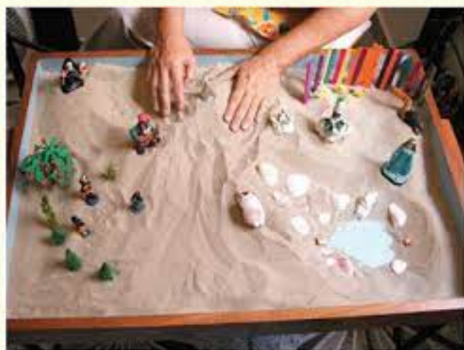
Figura 1: Caixa de areia.