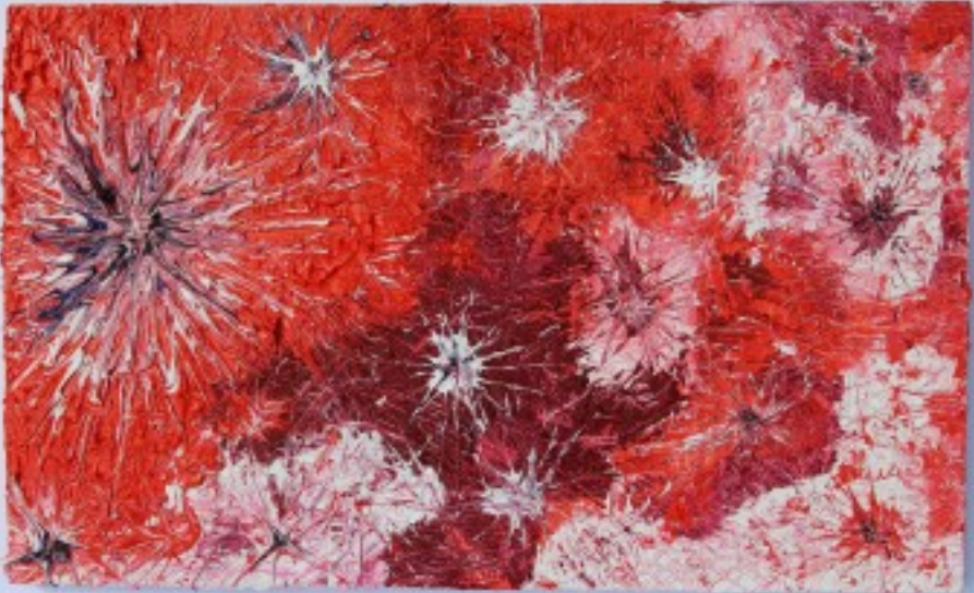
Incisões mentais: Sistema Nervoso Central em colapso Mind incisions: Central Nervous System in collapse Inzisionen im geist: Zusammenbruch des Zentralnerven Pedro Mendes (2023) Oil on wood 40 x 25 cm