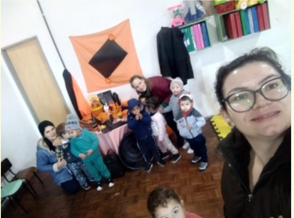
A turma do Maternal II, alguns momentos do ano de 2023.