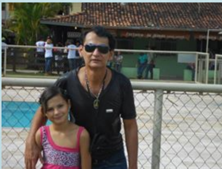
Eu e meu pai