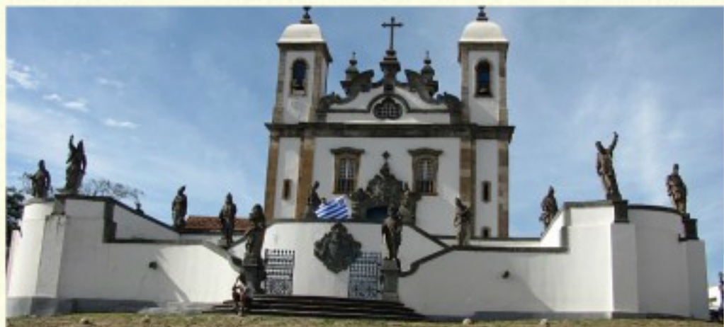
Igreja São Francisco de Assis, Ouro Preto MG