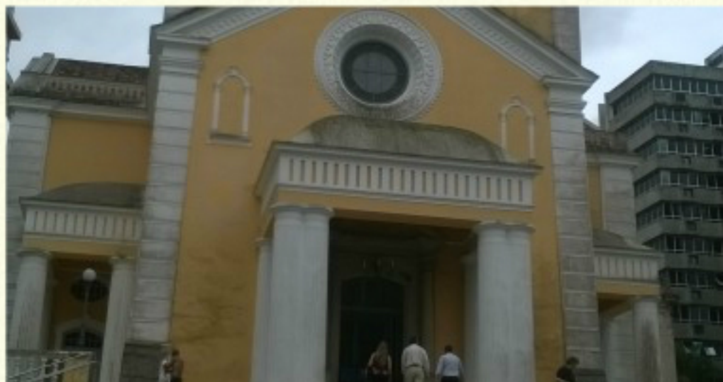
Catedral Metropolitana de Florianópolis