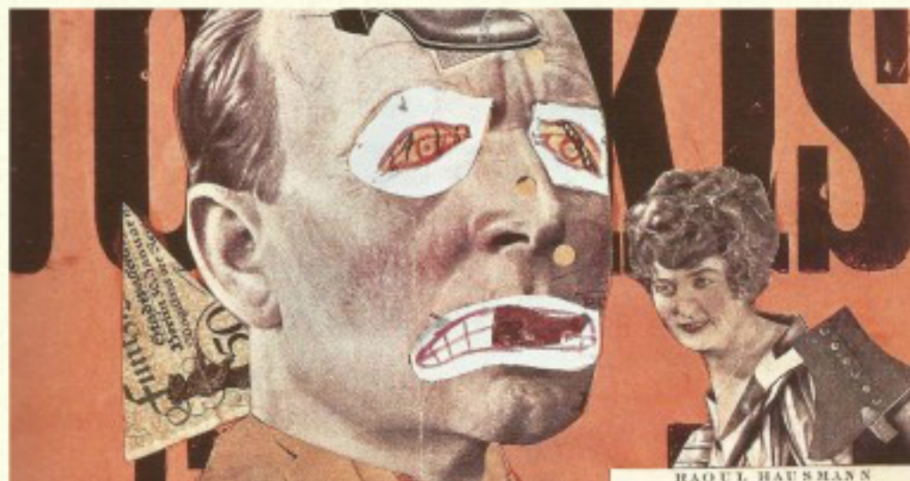
Raoul Hausmann, O crítico da Arte.