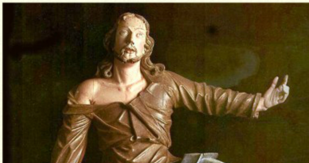
Cristo no Horto das Oliveiras, na Via Sacra de Congonhas