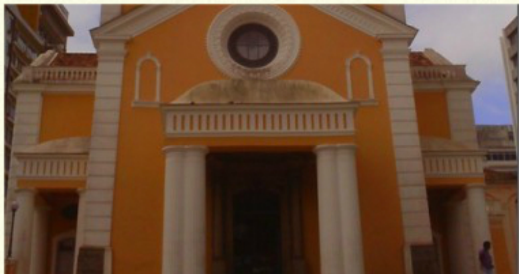
Catedral de Florianópolis SC

A Catedral Metropolitana de Florianópolis, dedicada a Nossa Senhora do Desterro, é a igreja na qual se encontra a cátedra da arquidiocese de Florianópolis, desde sua criação, em 19 de março de 1908. A edificação é tombada pelo Instituto do Patrimônio Histórico e Artístico Nacional.