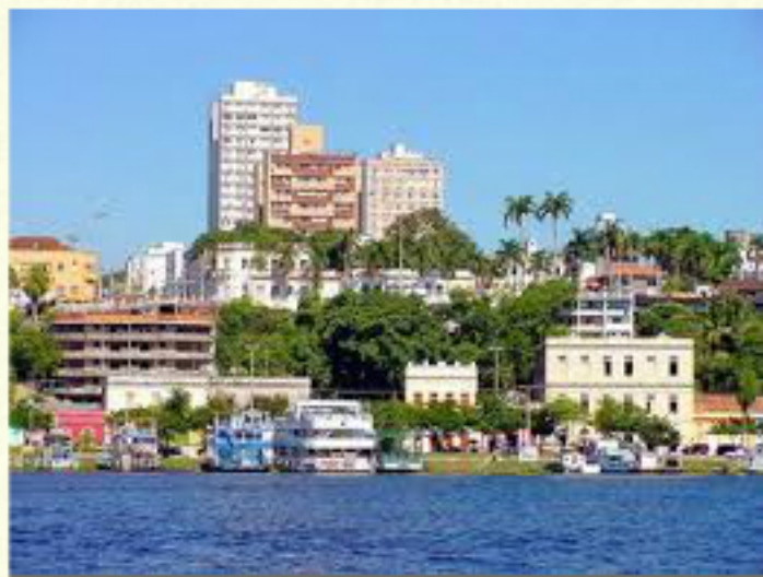
Corumbá - Pantal sul matogrossense