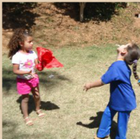
Jogo de peteca Minha turma de 4/5 anos em Macacos Nova Lima. 2012

Acredito que o brinquedo pronto não aguça a criatividade da criança é mais prazeroso brincar com o brinquedo feito por nós mesmos. Por isso na minha prática docente eu priorizo um trabalho com os brinquedos construídos pelos próprios alunos e tenho percebido que quando eles participam desse processo a brincadeira fica mais divertida e atraente.